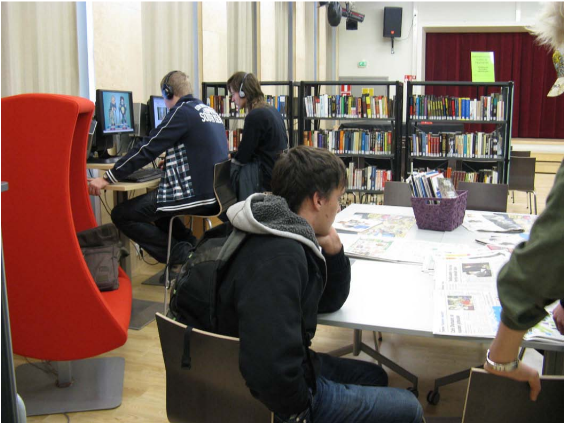
Hatanpään pojat lehtiä lukemassa.